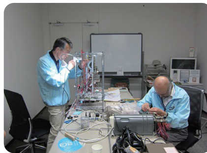
動態展示に向けた修理・復元