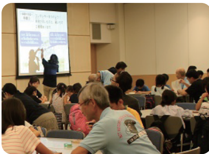
イベントサポート