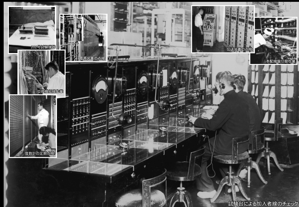
試験台による加入者線のチェック

Examples of maintenance work seen in photographs