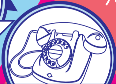
4号自動式卓上電話機