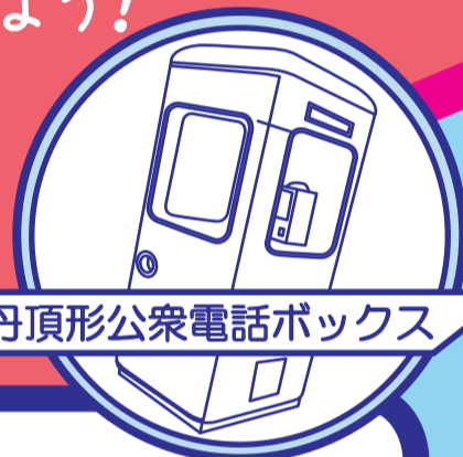
丹頂形公衆電話ボックス