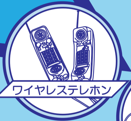
ワイヤレステレホン