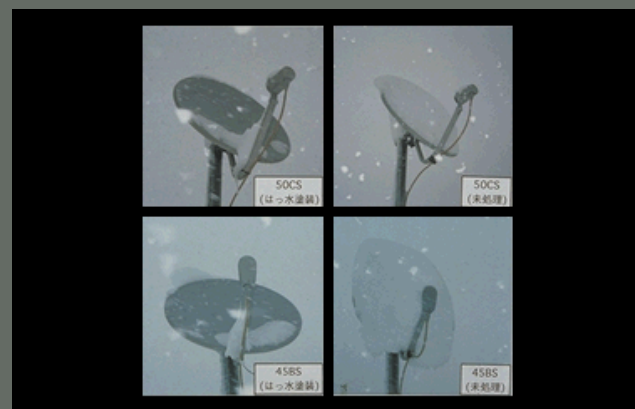
1994 はっ水性塗料による衛星アンテナの着雪防止