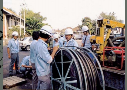
インドネシアプロジェクト

インドネシア国中部ジャワ地域の40万回線の建設、運営 を行う合併会社へ参画し、技術面・運用面でフルサポート するとともに、出資、役員派遣による経営参画を行う。なお、 98年6月に建設回線数を35万回線に削減。