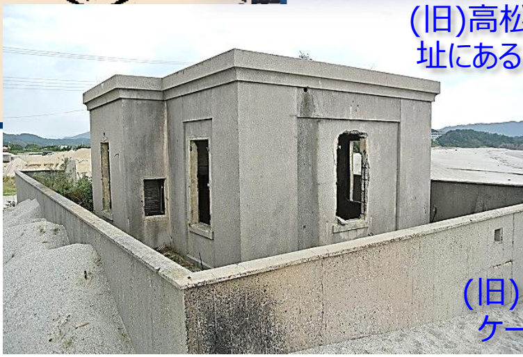
(旧)阿万浦 海底 ケーブル陸揚室