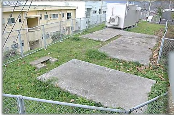
(旧)四ツ浜電話中継所址 (現)大久電話交換所