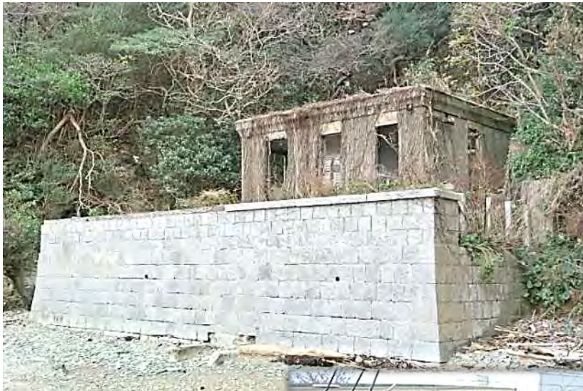
(旧)平磯水底線 陸揚室 【登録有形文化財】