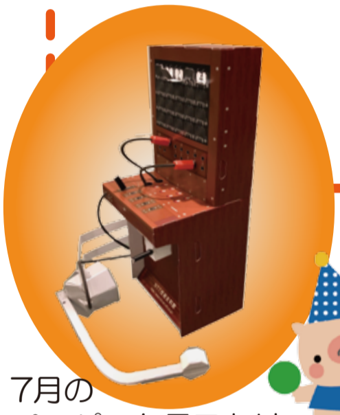
7月の ペーパークラフトは ヘッドホン付きの 手動交換機!

ワークブックを片手に館内を探さくしよう! ミッションコンプリートでプレゼントをゲット! 電信電話の歴史や電話のつながる 仕組みのなぞにせまれ!!